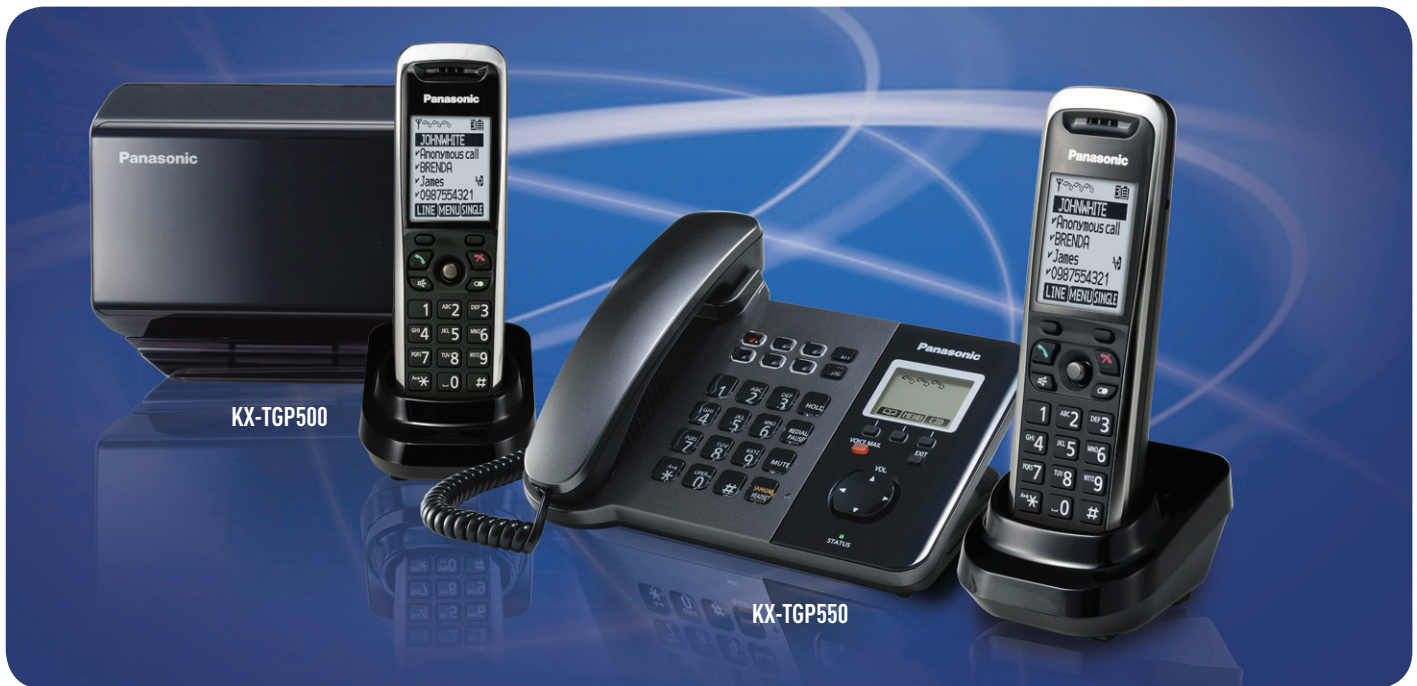
TGP500 - SIP-TELEFOONSISTEEM